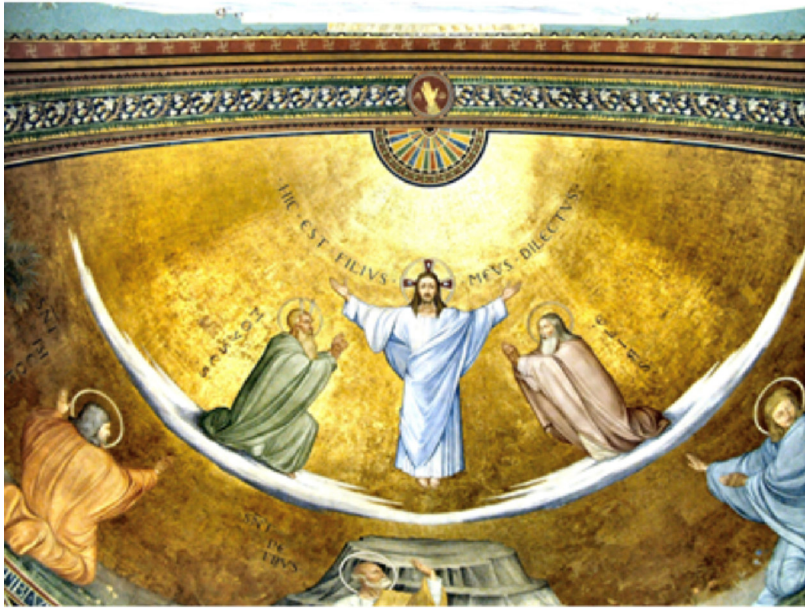
L'abside della Chiesa