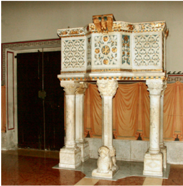
(Il Pulpito dopo lo spostamento )