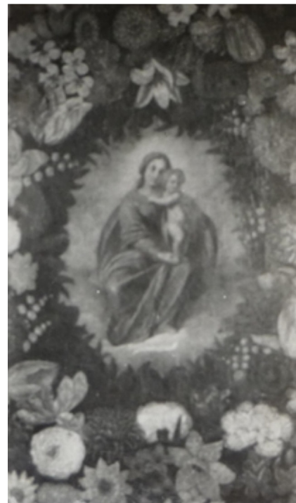
Arch.Fotografico Cass.1 n.661 - Soc.Arte eStoria Legnano Madonna con Bambino - Giò Batta Lampugnani

Probabilmente un regalo ai possessori dell'oratorio da parte del pittore.